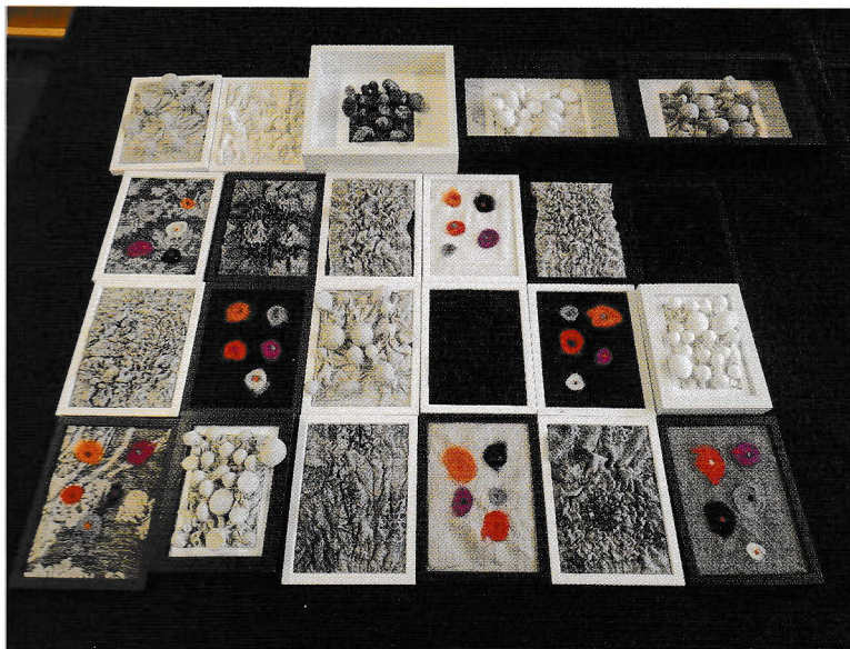
Die fertigen Kunstwerke